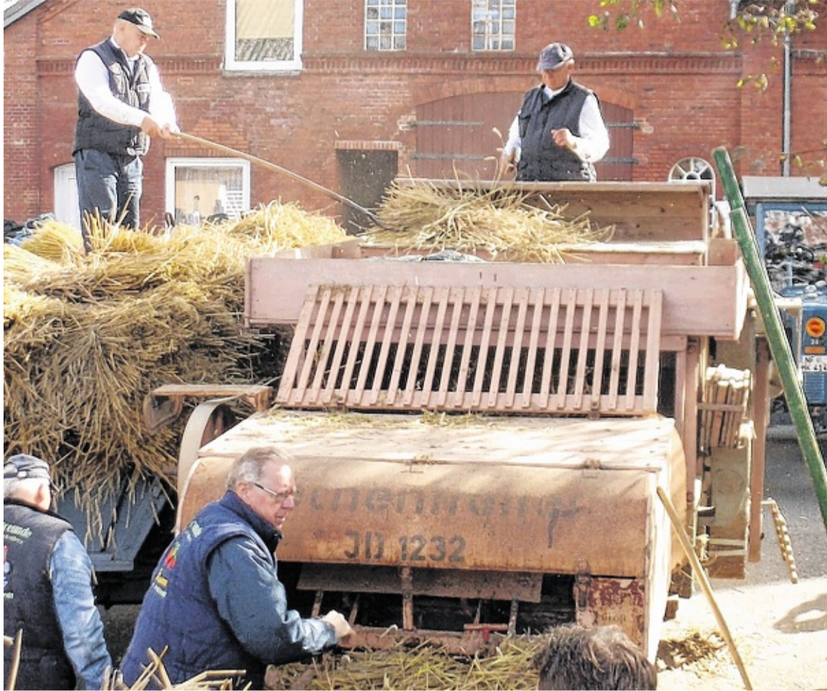
Dechentreiter un Lanz, Döschmaschien un Trecker, laten dat ole Döschen lebendig warrn.