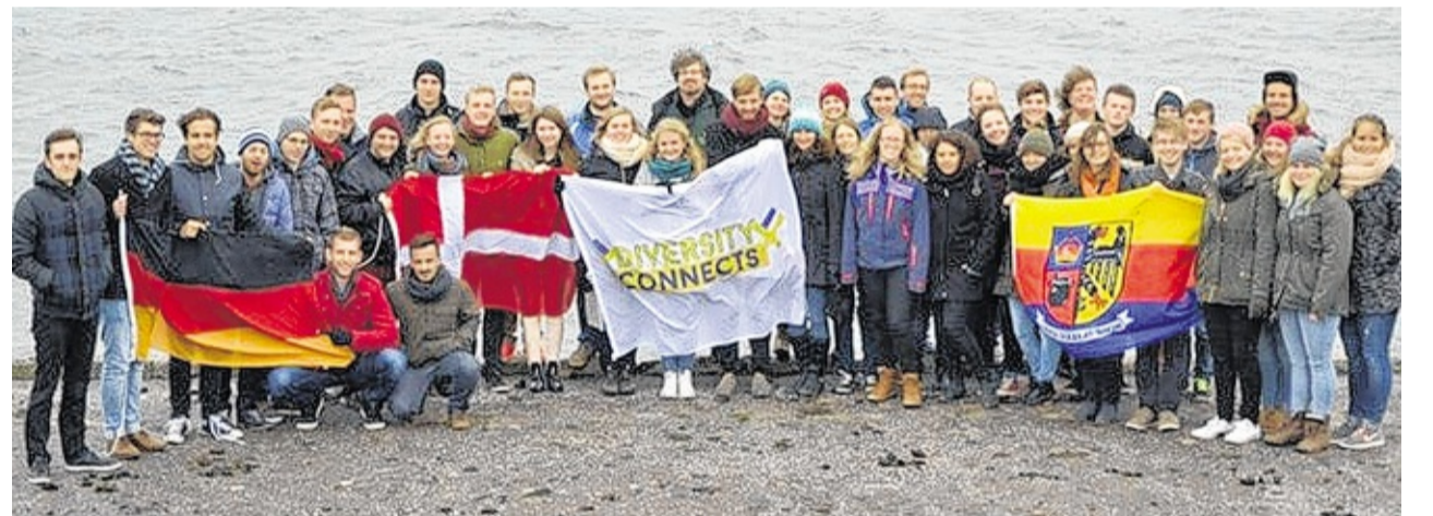
Uk wan bai e ütfluch aw Feer di hamel gra wus, da diiljnaamere foont JEV-seminäär ordi fernäid ouer en dää bait wääder. NFI