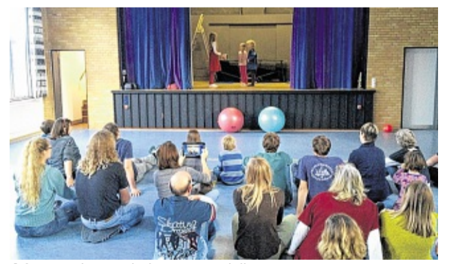
A jongen haa en letj teoterstak iinööwet