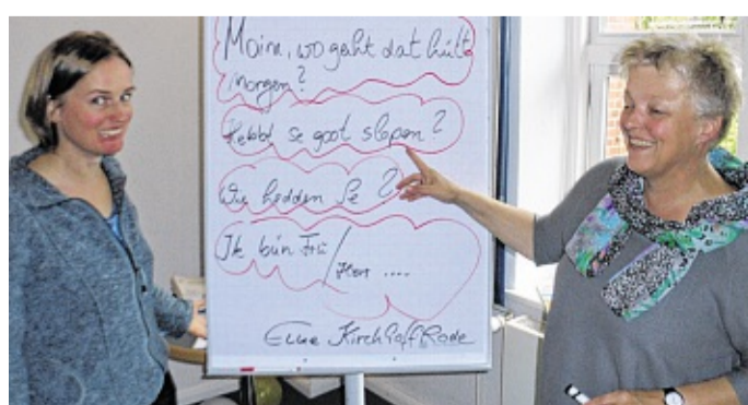
De Husumer Bildungsurlaub bedüüt een Week Plattdüütsch.

Un ganz bi to kriegen se all-hand Plietsches to de Umgang mit Wöör un Spraak bipuult.