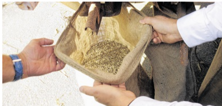
Jute-Säcke hangen ünner de Döscher – links för dat fiene Koorn un rechts för de Kaff.

De Oldtimerfrünn um de Glockenbarg sehen dat nich as Arbeit. De hebben Spooß bi dat Fachsimpeln, dat Klüttern un dat Koornmeihen mit en ole Binner. De Döschmaschien hebbt se schenkt kregen – de steiht nu wedder bi Erich Petersen op de Dänische Schanze un hett Roh bit anner Jahr bi de Schwabstetter Buurnmarkt. För all de Vereenslüüd blifft dat Mitenanner. Avers dat Grillen, de Buddel Beer un de Tass Kaffee – de sind denn je ok noch dor. Ingwer Oldsen