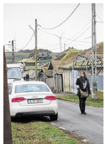
En latj toorp önjt Donau Delta.

Bukarest an schön dan nich fiiw stüne ma en bus kääre. Di näiste däi as dät program ma en draäwen ma lokäale politikere ofisjäl önjfängd. Deer-eefter häawe's en flashmob önjt teoter määged, weer schilde ma da noome foon da manerhäide huuchhüelen