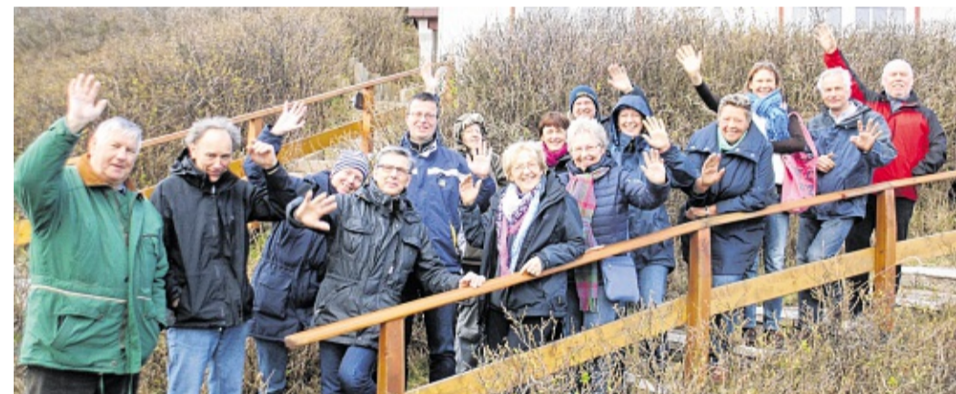
Rusige Wedder giff nich – blots verkehrte Kledaasch. OLDSEN