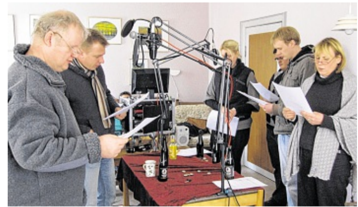
Bait apnaamen schal huum nau awpääse, wan huum önj e ra as. AA

rere gans ferschälw wääle önjt hood apstönje tu lätjen. Sü koon huum ja önj en flinjer manaame, wat gliks oustjartet unti önj en saloon , weer jüst bandiite e döör inkaame unti aw e äädersid foon e moune, weer al e grut lifde täiwt. Unti gans iinjfäch säid: Önj en hiirspal koon huum uk aw frasch e Titanic unergunge lätje. Wan huum üt suk stufe en film unti bloots en teoterstuk aw frasch määge wälj, dan wus dat määst ai möölik. Et wus iinjfäch tu jöör, tu swäär, tu apwändi. Fort seminaar häi Gary