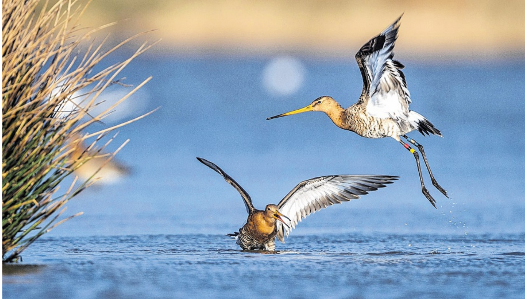
A rüütjern bred loongs a nuurdsiaküst nai bi weederskaant. Spiitigerwiis stun jo al sant en linger tidj üüb a ruad list.

Mini-Sketche op Platt: opschreven vun Malene Gottburgsen, illustreert vun Bettina Biewald, kost 5 Euros bi dat Plattdüütsch-Zentrum in Leck.