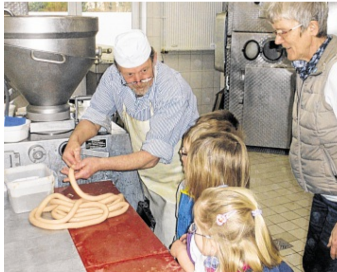
„Bit dat en richtige Würstchen is, muss dat noch dreiht warrn“ – Tönner Kinner maken dat Wurstdiplom. OLDSEN